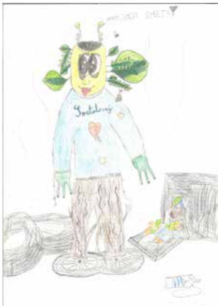
Živa Z., 3. b, OŠ Rodica